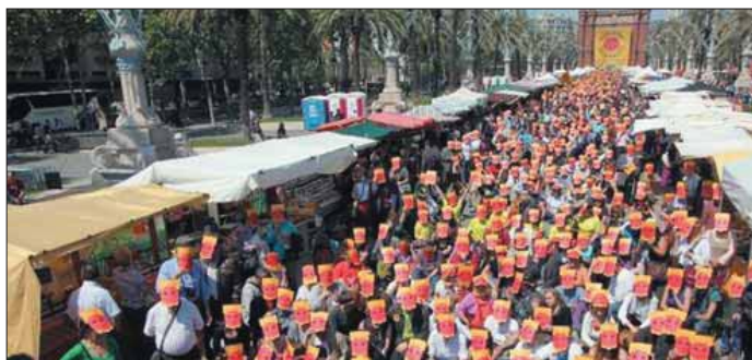
EL Passeig Il·lús Companys fou escenari d'una gran festa anti-nuclear