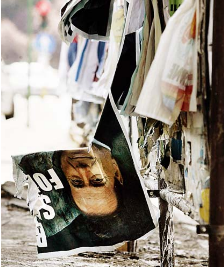
Un cartell electoral del primer ministre italià Silvio Berlusconi, implicat en diversos casos de corrupció.

tra banda una lectura esplèndida i molt recomanable— és que, des d'una òptica europea, moltes vegades tan sols concep la corrupció com a quelcom essencialment públic, encara que la corrupció empresarial és cada cop una pràctica més estesa; segons afirma Francesc Sanyu en el pròleg, hem d'acceptar que «entre empresaris privats hi hagi tractes de favor i tota